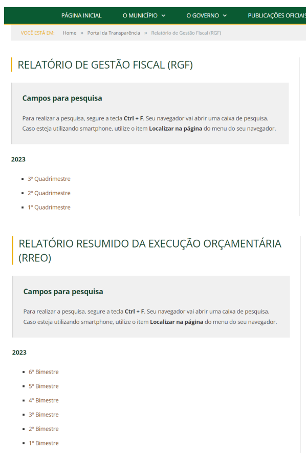
Figura 2 – Publicações RREO e RGF

No exercício financeiro de 2022 foram publicados os RELATÓRIOS DE GESTÃO FISCAL e os RELATÓRIOS RESUMIDO DE EXECUÇÃO ORÇAMENTÁRIA, no sítio oficial do município conforme a figura abaixo: